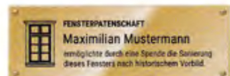
Beispiel für Plakette