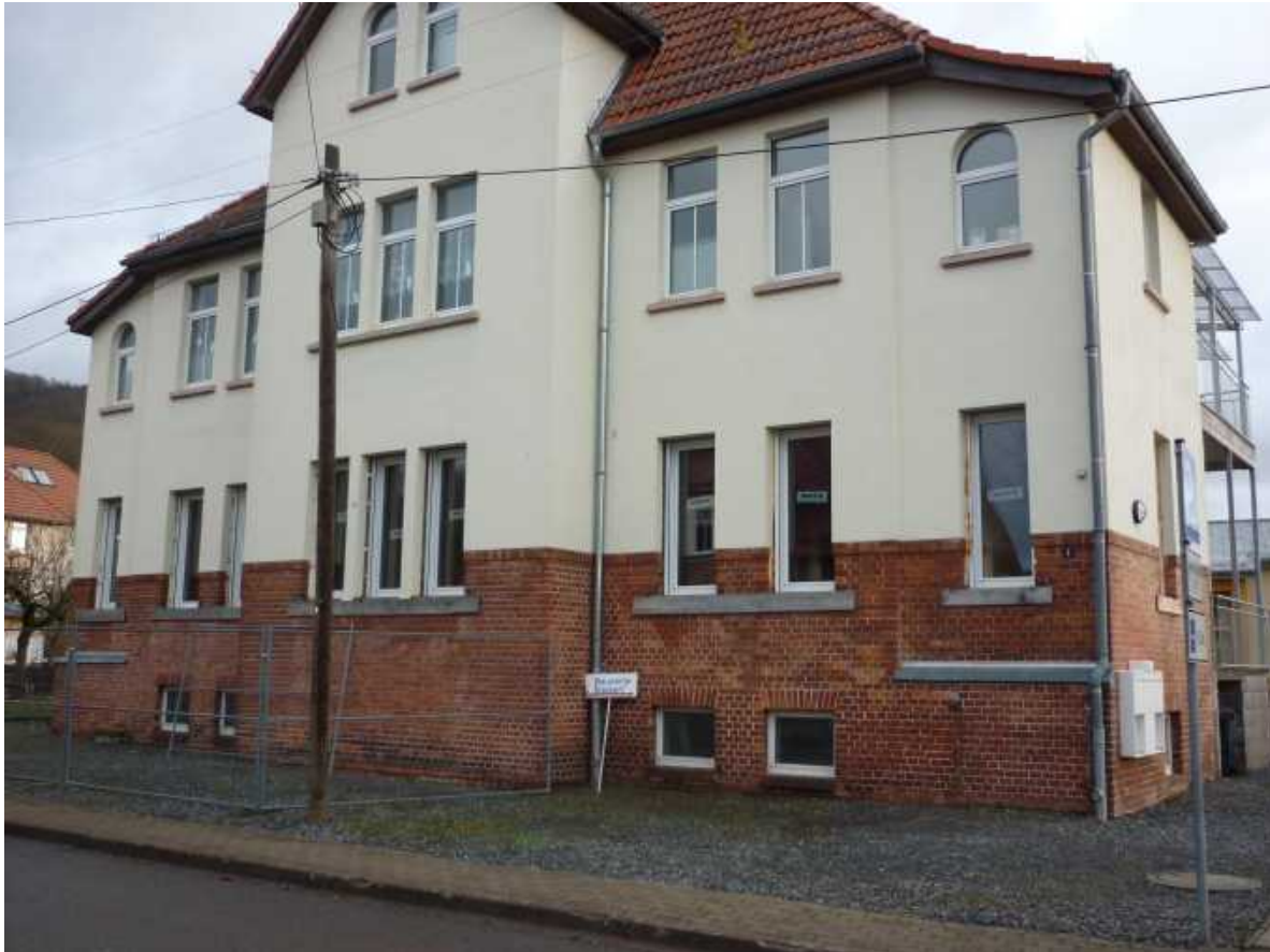
Nr. 11 – Schmiedestraße 6