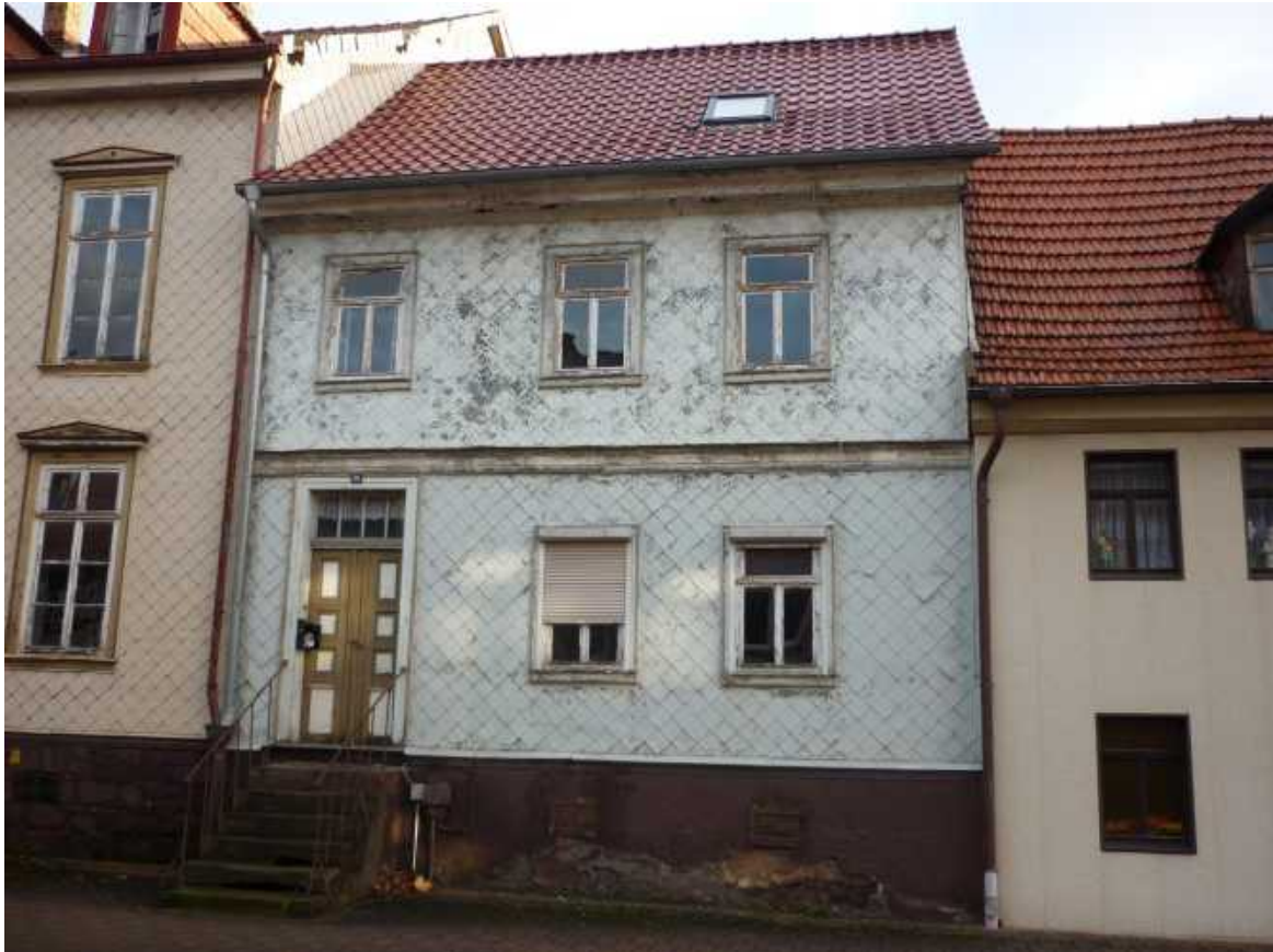
Nr. 8 – Ilgerstraße 43