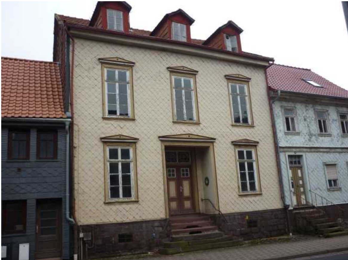
Nr. 17 – Ilgerstraße 30