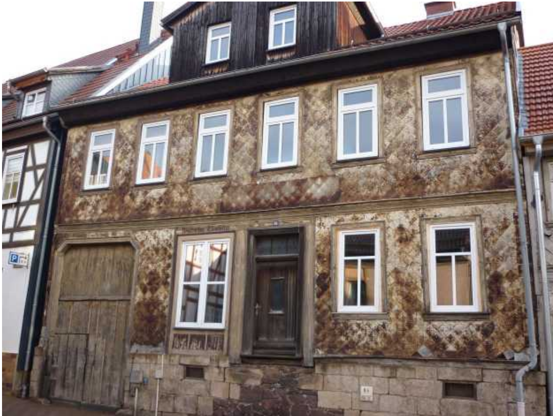
Nr. 6 – Ilgerstraße 32