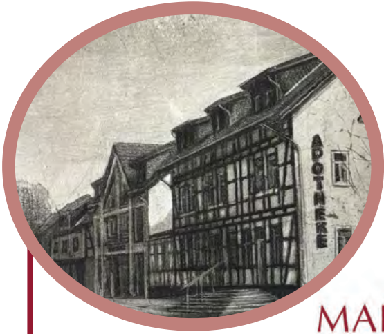
Grafik: Klaus-Dieter Kerwitz von 2001